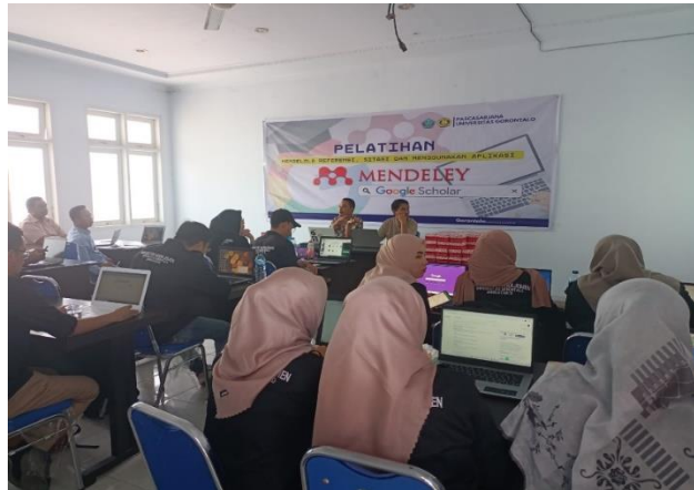
Gambar 3. Pemberian Materi

Pada agenda pemberian materi, indikator pencapaian program pelatihan di dasarkan pada penilaian sebagai berikut :