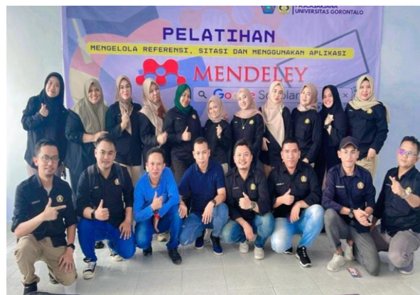
Gambar 4. Peserta Pelatihan

Peningkatan kapasitas mahasiswa bisa dilakukan dengan berbagai cara, salah satunya dengan aktif menulis sebuah karya ilmiah. Pada dasarnya mahasiswa masih menggunakan sistem copypaste pada saat menulis kutipan maupun membuat daftar pustaka. Padahal telah banyak aplikasi yang menyediakan layanan tersebut salah satunya aplikasi mendeley. Olehnya, program pengabdian semacam ini sangat dibutuhkan. Para peserta merasa terbantu dengan adanya pelatihan mendeley dan bagi tim pelaksana hal ini merupakan salah satu peran dosen dalam menjalankan tridarma perguruan tinggi yakni darma pengabdian pada masyarakat.