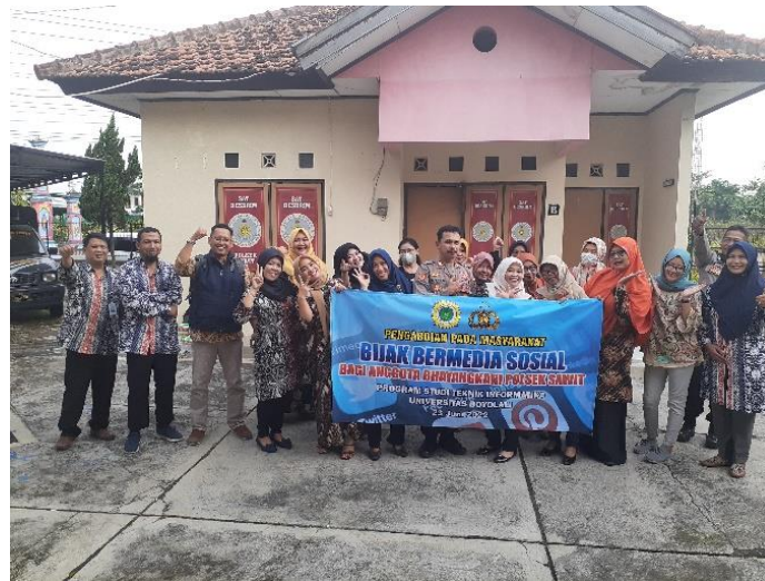
Gambar 2. Foto Bersama Peserta dan Tim Pengabdian