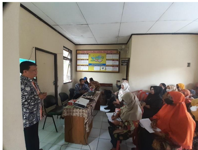
Gambar 3. Foto Tim Pengabdian Memberikan Sosialisasi